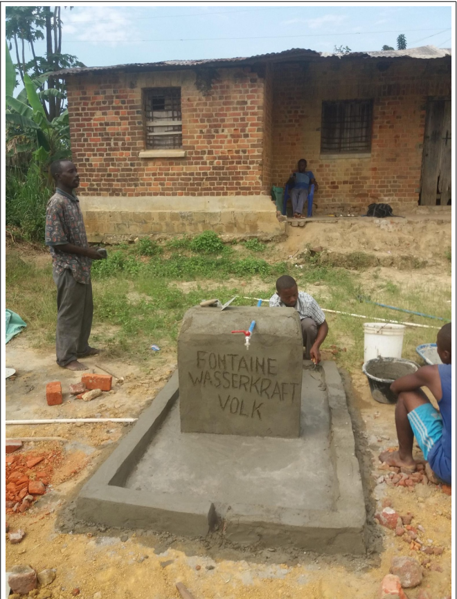
Krano-duopo Wasserkraft Volk