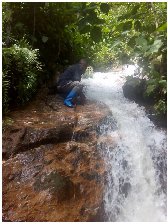
2018/19 : Montara rivereto/rojo Abuki