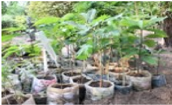
Annona Squamosa, Carica Pupaya kaj Persea Americana arboj