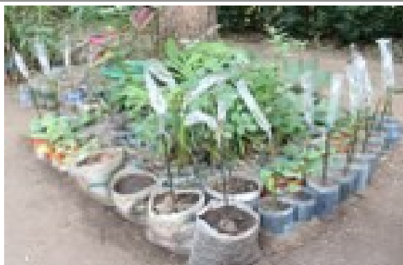
Persea Americana greftado arbidoj