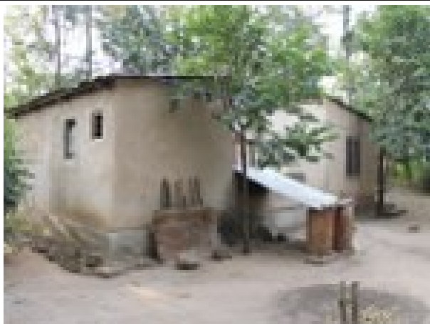
Domo kaj laborejo de Sylivester