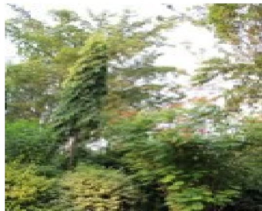
Caesalpinia Pulcherima , Saraca Indica kaj Terminalia brownie arbo