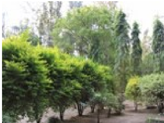
Azadirachte Indica , Saraca Indica arboj kaj ornamajxo arbeto