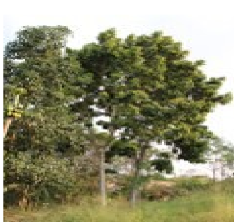
Persea Americana khaya Anthotheca arboj