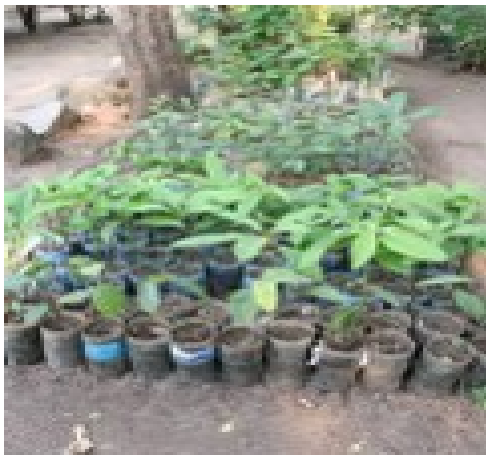
Artocoupus Heterophyllus kaj Persea Americana arbidoj

La fotoj - maldensaj - akompanas la nomoj; iam venos informoj pri la arboj.