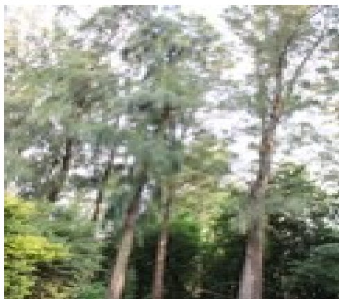
Cansuarima Montana arboj