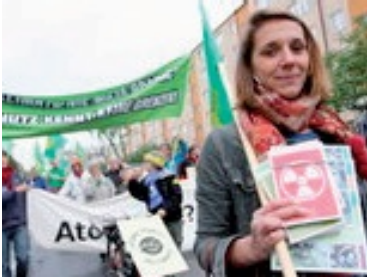
Polaj kontraŭ-atomaj manifestacioj